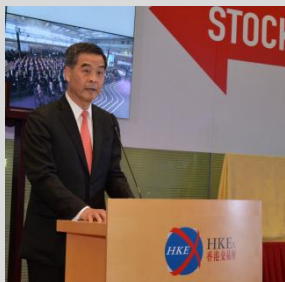
香港特别行政区行政长官梁振英

(左至右)：中国结算香港子公司筹备组组长姚蒙、上海证券交易所副总经理徐明、香港交易所集团行政总裁李小加、香港证监会主席唐家成、中央人民政府驻香港特别行政区联络办公室副主任仇鸿、香港交易所主席周松岗、香港特别行政区行政长官梁振英、署理财政司司长陈家强、中国证监会副主席刘新华、香港金融管理局总裁陈德霖、深圳证券交易所总经理宋丽萍及香港证监会副行政总裁张灼华。