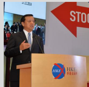
香港交易所集团行政总裁李小加