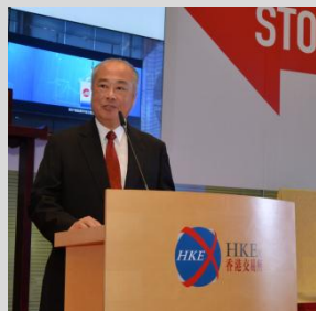
香港交易所主席周松岗