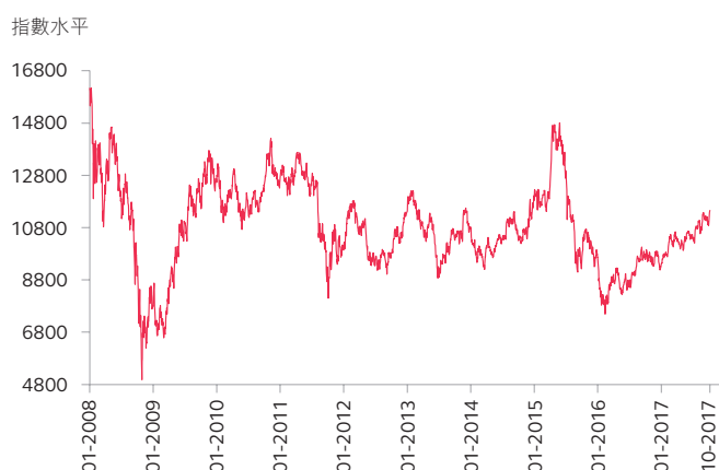
圖一：恒生中國企業指數由2008年1月至2017年10月的走勢圖*

為迎合個人投資者的買賣及對沖需要，香港交易所分別於2008年8月31日及2016年9月5日推出小型恒生中國企業指數期貨及期權合約。小型合約的價值為標準合約的五分之一。