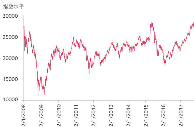
图一：恒生指数由2008年1月至2017年10月的走势图*

为迎合个人投资者的买卖及对冲需要，香港交易所分别于2000年10月及2002年11月推出小型恒生指数期货及期权合约。小型恒生指数期货及期权的合约价值为恒生指数期货及期权合约的五分之一。