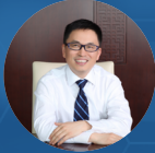
高瓴資本創始人兼首席執行官

隨著經驗和複雜性的積累，我們將會探討就生物科技章節的不同方面為企業提供更多指引。