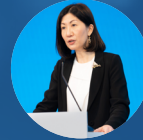
香港交易所上市主管