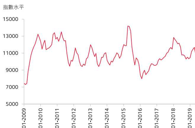
圖一：恒生中國企業指數由2009年1月至2019年5月的走勢圖*

為迎合個人投資者的買賣及對沖需要，香港交易所分別於2008年8月31日及2016年9月5日推出小型恒生中國企業指數期貨及期權合約。小型合約的價值為標準合約的五分之一。