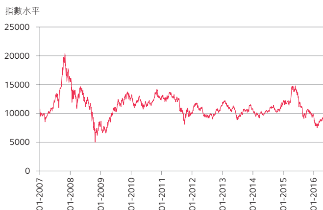
圖一：恒生中國企業指數由 2007 年 1 月至 2016 年 5 月的走勢圖*

為迎合個人投資者的買賣及對沖需要，香港交易所分別於 2008 年 8 月 31 日及 2016 年 9 月 5 日推出小型 H 股指數期貨及期權合約。小型合約的價值為標準合約的五分之一。